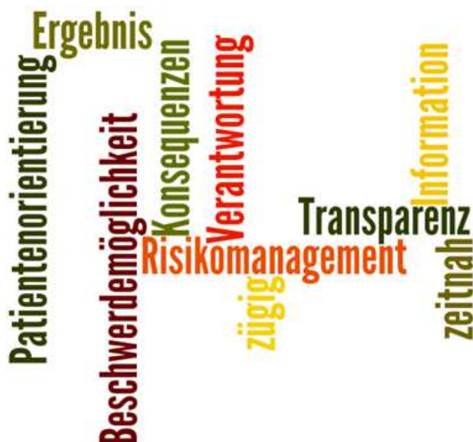
Abbildung 1: Schlagworte zum patientenorientierten Beschwerdemanagement