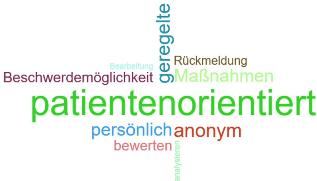
Abbildung 1: Schlagworte zum patientenorientierten Beschwerdemanagement