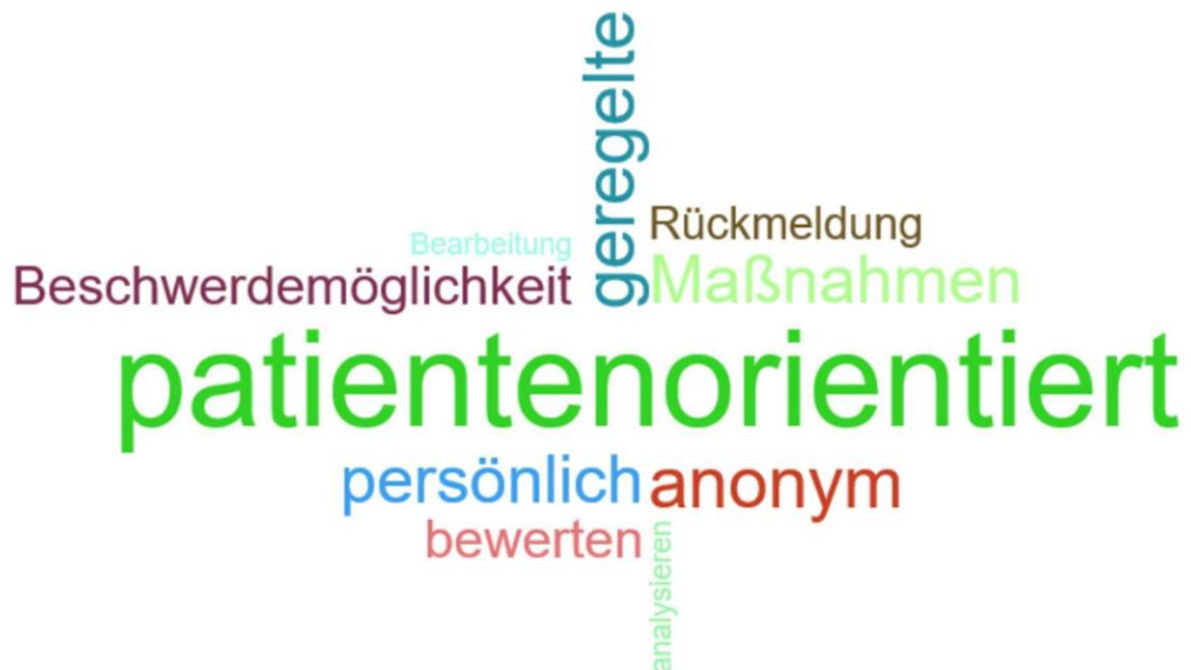
Abbildung 1: Schlagworte zum patientenorientierten Beschwerdemanagement